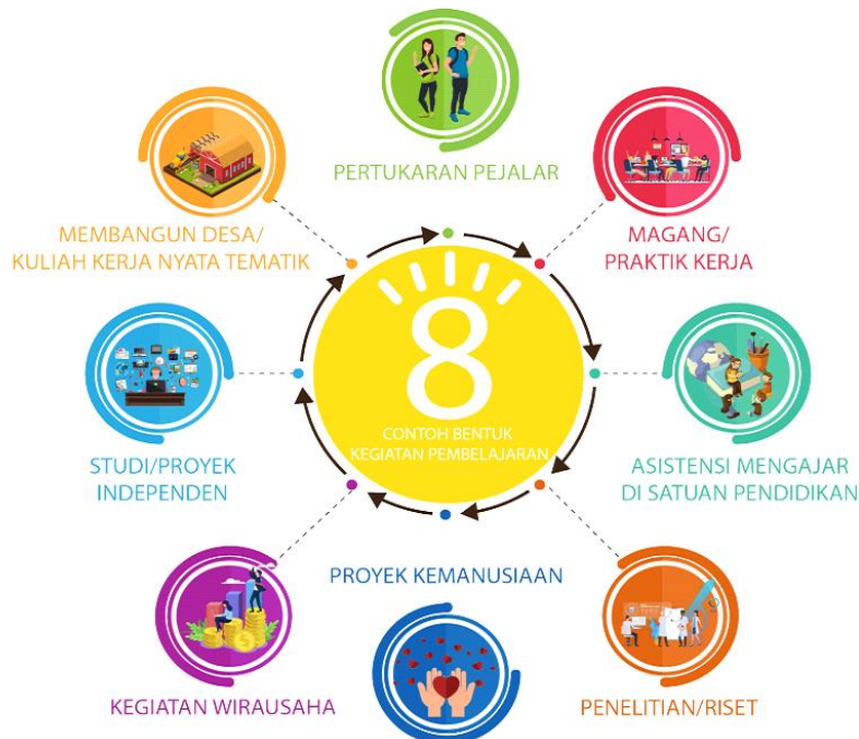
Gambar 1. Kegiatan pembelajaran sesuai Permendikbud No 3 Tahun 2020 Pasal 15 ayat 1

Penjelasan rekomendasi konversi sks dapat dilihat pada Buku Pedoman PKM. Bentuk kegiatan pembelajaran yang sesuai dengan PKM-RE adalah Penelitian/Riset, dan Studi/Proyek Independen seperti terlihat dalam Gambar 1.