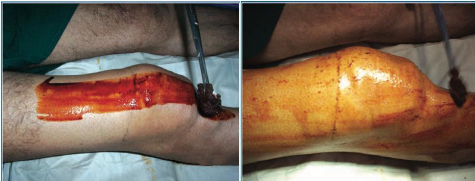
Gambar 2. Tindakan asepsis dan antisepsis