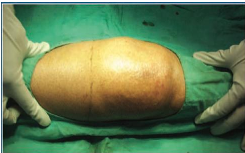
Gambar 3. Demarkasi area injeksi dengan doek steril