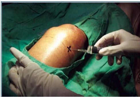
Gambar 5. Infiltrasi lokal anaestesi pada daerah injeksi