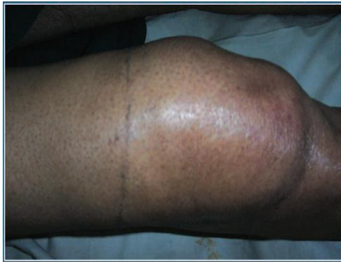
Gambar 1. Haemarthrosis genu

12. Inform consent mengenai kemungkinan terjadinya nyeri paska injeksi sendi