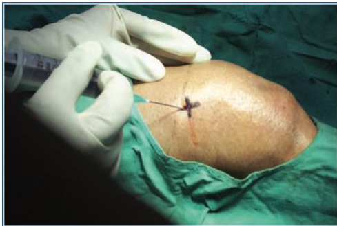
Gambar 6. Inseri jarum suntik 18 G pada lokasi injeksi