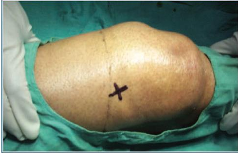
Gambar 4. Marking lokasi injeksi dengan marker steril pada superolateral patella ( merupakan titik perpotongan garis imajiner yang malalui tepi lateral patella dan tepi superior patella)